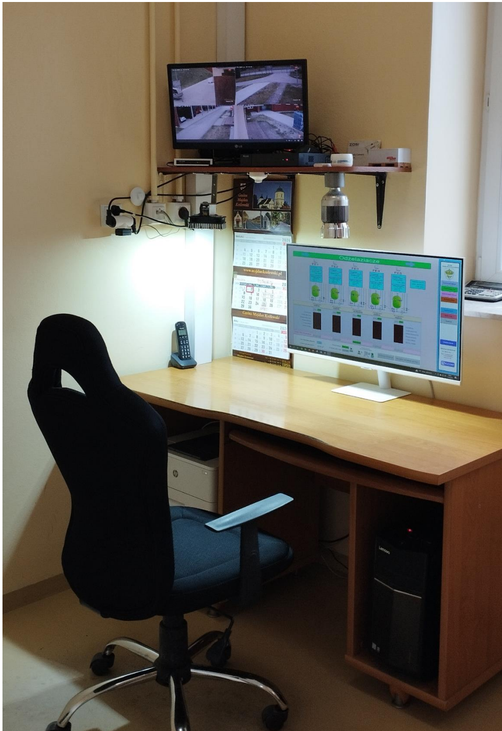
Remont pomieszczeń SUW w Hucie Komorowskiej