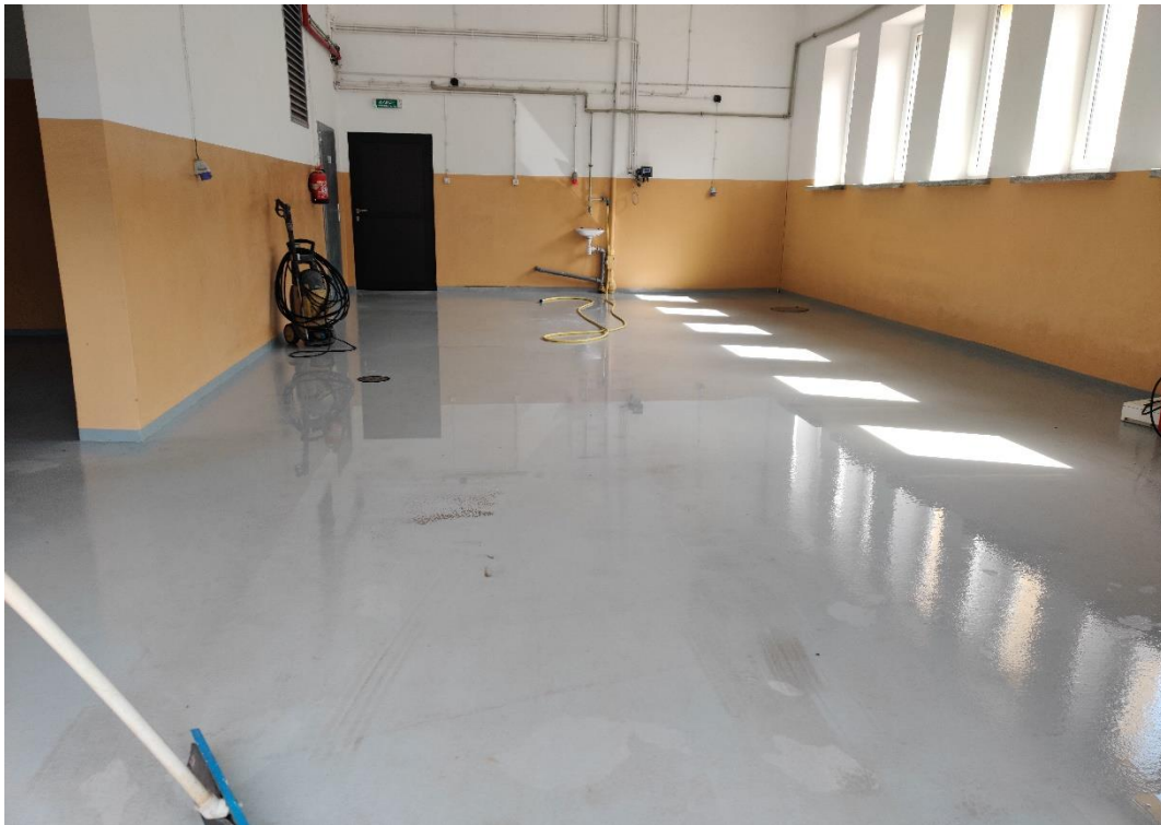
Remont budynku Stacji Uzdatniania Wody

Ponadto GZWKiO w Majdanie Królewski w 2023 r. otrzymał od Gminy Majdan Królewski przyczepę samochodową ciężką, kosiarkę bijakową Telex, uszczelnienie zbiornika zagęszczacza osadu nadmiernego na oczyszczalni Rusinów.