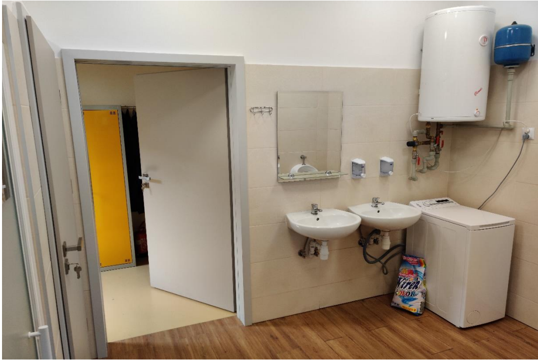
Remont pomieszczeń SUW w Hucie Komorowskiej