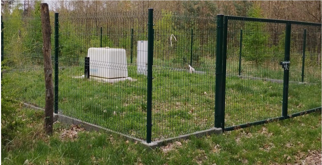
Studnia głębinowa w Hucie Komorowskiej