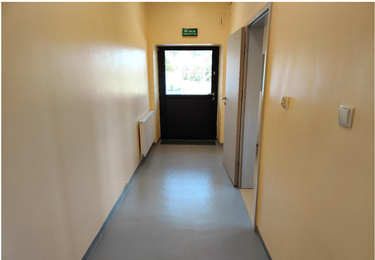
Remont budynku Stacji Uzdatniania Wody